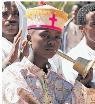
Die tiefe Religiosität äthiopischer Christen zeigt sich allenthalben. Spektakulär sind Felsenkirchen wie in Lalibela (oben), und voller Stolz und Selbstverständlichkeit bekennen sich Priester, Theologiestudentinnen und Novizen (unten von links) zu ihrem Glauben.